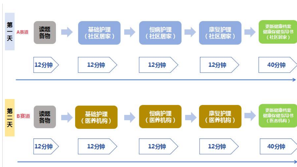
图1 老年护理与保健场景、模块流程图